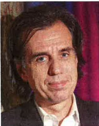
Psychiater Dirk De Wachter vindt een instelling niet de ideale omgeving voor een kind, maar afstand creëren kan volgens hem soms wonderen doen.