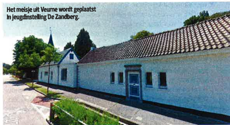
Het meisje uit Veurne wordt geplaatst in jeugdinstelling De Zandberg.

Als je als ouder gelijk wilt halen in een jeugdrechtbank, moet je ze laten luisteren naar wat het kind zegt. Dan sta je sterk. Maar als een kind constant bij één ouder is, terwijl er een vijandig contact bestaat tussen beide ouders, raakt dat kind gemakkelijk gemanipuleerd. Op een bepaald moment heeft mijn oudste dochter nog gezegd dat ik haar heb willen kidnappen naar het buitenland.