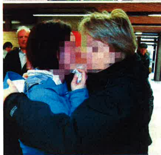
De mama en oma barstten in tranen uit toen ze hoorden dat hun (klein)dochter van school was geplukt en naar de instelling was gebracht.